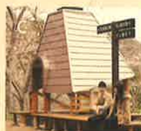
佐久間ダム・さくらの駅(佐久間ダム入り口前バス停)