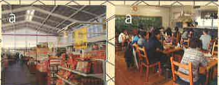
都市交流施設 道の駅保田小学校

TOKYO 鋸南について TOKYO WAN AQUA-LINE EXPV. introduction to the KYONAN KURIHAMA