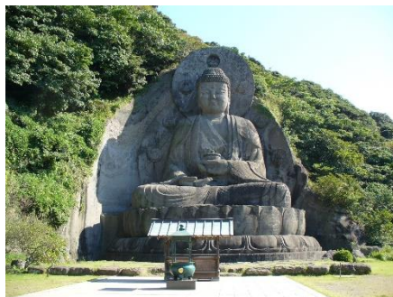
薬師瑠璃光如来坐像：日本寺