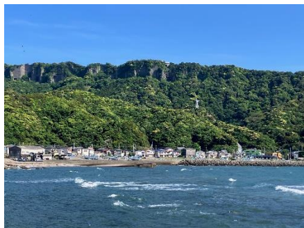
金谷の町から見た鋸山