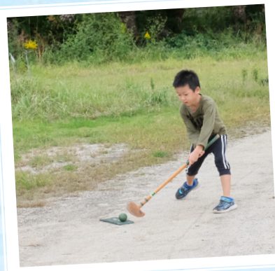
▲グラウンドゴルフ 広いグラウンドでボールを 打ち合い、少ない打数を競 うスポーツ。