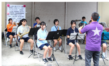
▲鋸南中学校吹奏楽部