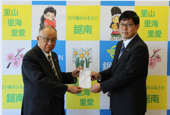
▲白石町長と小倉議長代行