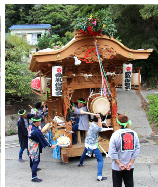
▲2tを超える大型の屋台