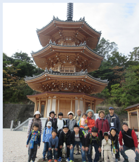
▲今年完成・公開された三重塔

放課後子ども教室「ザ・鋸山2」が11月8日に開催されました。児童保護者等合計21人が参加し、三重塔や日本寺本堂、千五百羅漢等を見学しながら山頂を目指しました。参加した児童からは、「はじめて百尺観音を見て、こんなに大きなものを掘ったことがすごいと思った。」との感想が聞かれました。