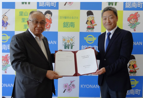
▲白石町長と内山委員長

内山委員長からは、「この報告書が観光まちづくりの推進に向けた重要な指針となり、町の魅力向上と地域活性化に寄与することを願う」と話されていました。