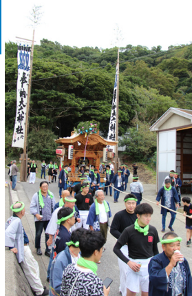
▲大六天神社を出発