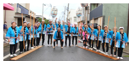
▲内宿区鯨唄保存会