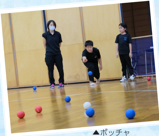
▲ボッチャ 赤と青のボールを投げ合い、目標球に近づけて得点を競うスポーツ。

ルールが簡単で 子どもから大人まで 楽しめるスポーツを、 それぞれのペースで 楽しみました。