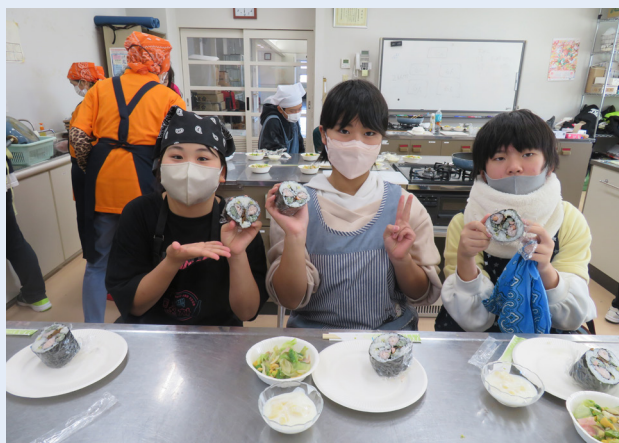
▲健康づくり推進員との太巻き作り

海洋センターでは、夏の「きょなんB G塾」高学年の部が、津波警報発令により中止となってしまったため、「きょなんB G塾 秋」を実施しました。