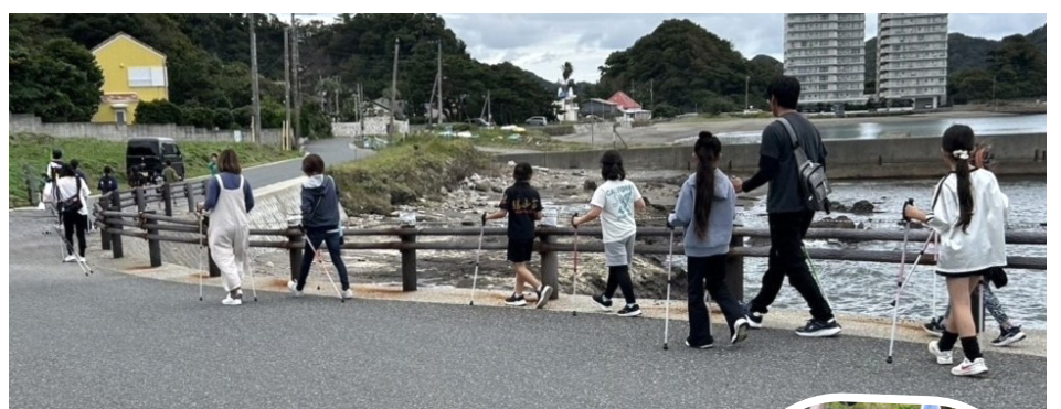
▲ポールウォーキング ポールを持って歩く全身運動。膝や腰への負担も 少なく、姿勢改善や筋力アップなど、健康づくりに ぴったりです。