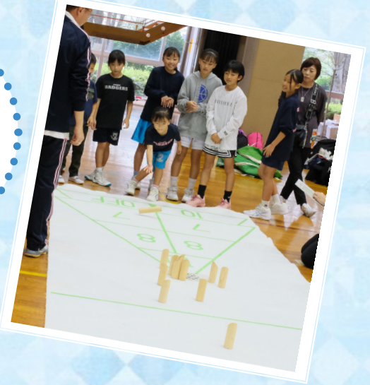
モリック▶ 木のピンを狙って倒し、 得点を競うスポーツ。

ルールが簡単で 子どもから大人まで 楽しめるスポーツを、 それぞれのペースで 楽しみました。