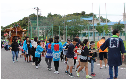
▲保田しおさい学校の子どもたちも参加