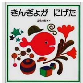
著 者：五味太郎 出版社：福音館書店

図書司書が選んだ乳幼児向け 子どもに読んで欲しい本100選はロビー、子育て広場に揃えてありますので是非お越しください。中央公民館の図書室では、貸し出し(2週間)を行っています。絵本等もロビーにたくさんご用意してありますのでご利用ください。