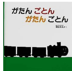
著 者：安西水丸 出版社：福音館書店