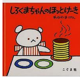
著 者：わかやまけん 出版社：こぐま社