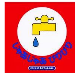
著 者：まついのりに 出版社：偕成社