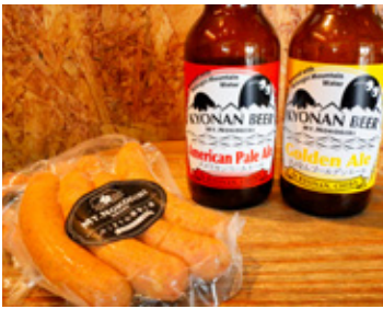
▲ビールとジューシーなソーセージ

鋸南町に訪れる方々に、また来たいと思っていただける「地域のクラフトメーカー」を目指し、町内で生産された農産物を使用したクラフトビールや頼朝桜の枝でスモークしたソーセージを販売しています。