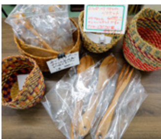
▲おすすめはアフリカ住民手作り雑貨

町内のはちみつや新鮮な野菜、珍しいアフリカ原住民手作り雑貨などを販売しています。