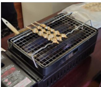
▲あさり串焼きは1本100円

昭和30～40年代の駄菓子屋・お祭りの夜店などのおもちゃを眺めながら楽しく食事ができます。ラーメン・うどん・カレーライスなどは500円ポッキリの昭和価格となっています。