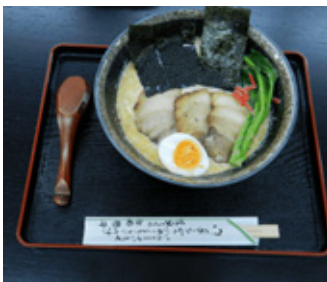
▲おすすめは豆乳ラーメン

他のお店で提供していないものを作りたくて、豆乳ラーメンを考案しました。お客さまから「病みつきになる」とありがたいお言葉をいただいています。また、他のメニューも出来る限り地の物で手作りしています。