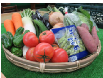
▲採れたての新鮮な野菜