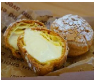
▲人気のシュークリーム

幅広い年齢層にご利用していただけるよう、できるだけ地元の旬な食材を使っています。