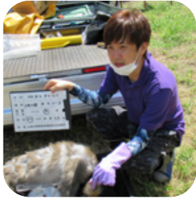
箱罿、くくり罿を同時に設置▶