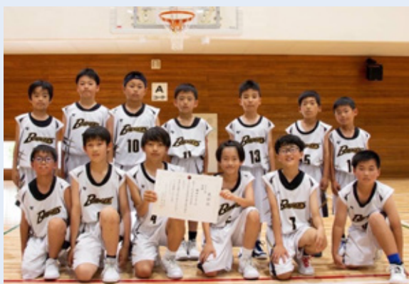
▲男子の部優勝の鋸南バジャーズ選手

男女ともに6月25日、7月1日、2日に開催される第3回TOMIURAさざ波大会千葉県予選会へ出場します。