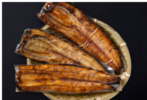
▲鰻のかば焼き 提供事業者: 日本DSSフーズ株式会社