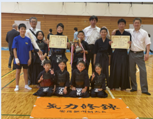
▲出場した安房鋸南剣友会の選手