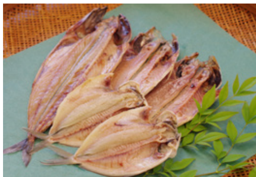
▲干物セット 提供事業者: 提灯屋干物店