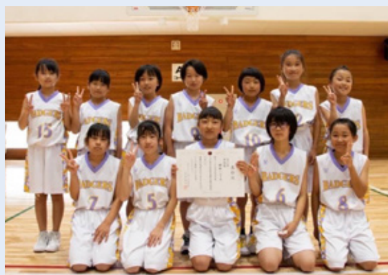
▲女子の部準優勝の鋸南バジャーズ選手