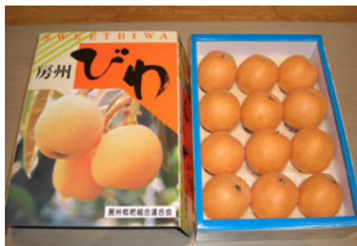
▲房州びわ 提供事業者: 鋸南枇杷組合