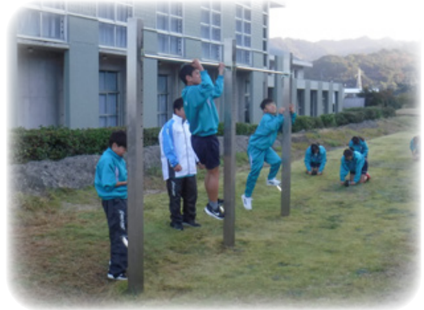
▲寄付金で中学校に設置した高鉄棒