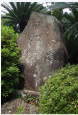
▲長谷川馬光の句碑

江戸や房総の富裕層に浸透していた葛飾派の俳人らが、おそらく大挙して集まるだろうこの一大イベント開催は、日本寺の羅漢PRにもなると愚伝は考えたのではないのでしょうか。