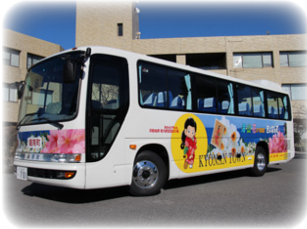
▲寄付金で購入した社会教育バス