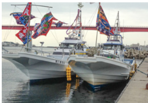
▲釣り船乗船補助券 提供事業者: 株式会社萬栄