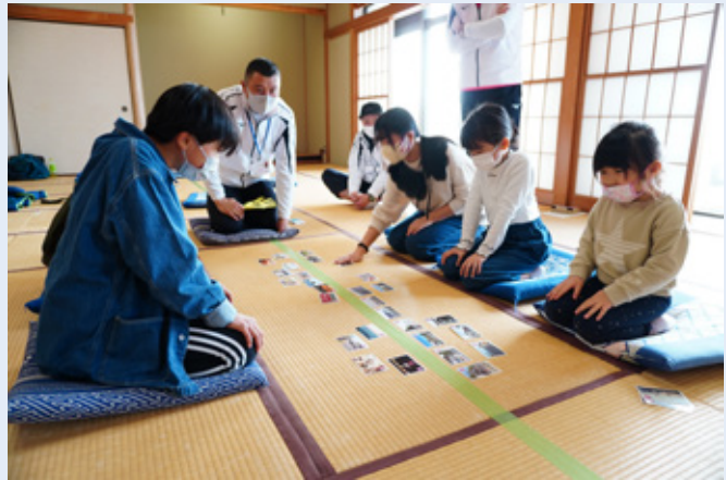
▲真剣なまなざしの子どもたち

青少年相談員が作成したオリジナルの郷土かるたを使用し、子どもたちからは「町の色々なことを知ることができた。楽しかったので、また参加したい。」と感想がありました。