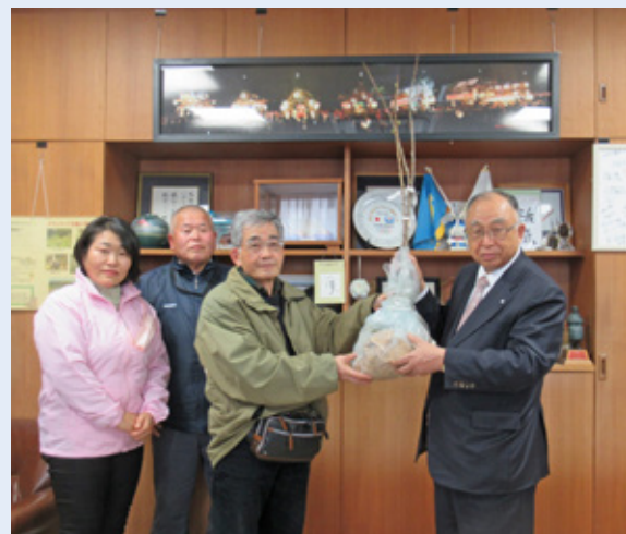
千葉鋸南日本花の会の皆さんと白石町長▶

夢待桜は、正月に見ごろを迎える優しい 色合いが特徴で、佐久間ダム公園に植栽し ました。