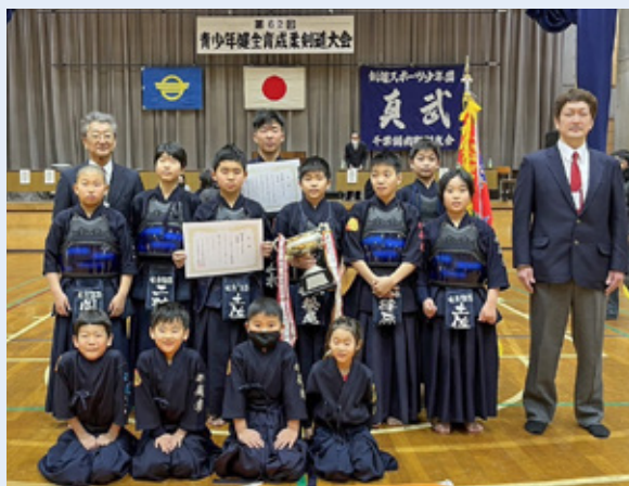
▲安房鋸南剣友会のメンバー

柔道は、鋸南柔道クラブをはじめ安房郡市内の6団体が参加し、小学生を対象とした技術講習や合同練習を行いました。