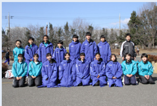
駅伝部のメンバー▶