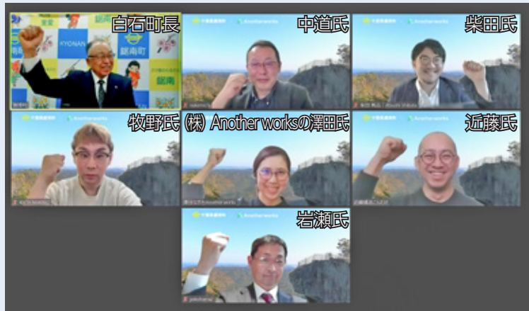
▲オンラインで開催した就任式

委嘱期間は7月31日までで、オンラインによるアドバイスを中心に施策推進にご尽力いただきます。