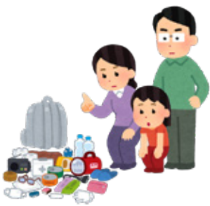
日ごろの備えを 再チェックしましょう

「大災は忘れたころにやってく る」と言いますが、忘れずに準備 をすることで「地震を「災害」に しないことができます。皆さんも 準備を進めていきましょう。