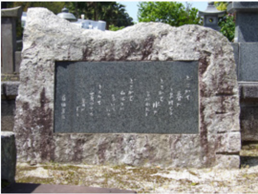
▲「どこかで春が」歌碑