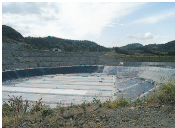
建設が進む汚染土壌処理施設

要望 この美しい 町を汚染土の町にしないよ う、官民一体となり尽力し て欲しい。