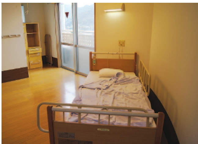
特別養護老人ホームのユニット型個室

思われるが、一カ月5万円ほどで入れるような特別養護老人ホームを建設できないか。雇用も生まれ、建設費用も回収できると思うが、町長 建設計画はありませんが、鋸南町は地域の福祉・介護予防を重要視し、いろんな取り組みを実施している自治体だと思っています。 要望 現在、町内にある80名定員の特養施設への入居待機者は182名。鋸南町からも82名の待機者があり、今後も常時80名程度の待機者が見込まれる。行政には先を見据えた先見性が必要であり、介護が必要になっても安心して暮らせる健康なまちづくりの具体的なビジョンを作成してほしい。