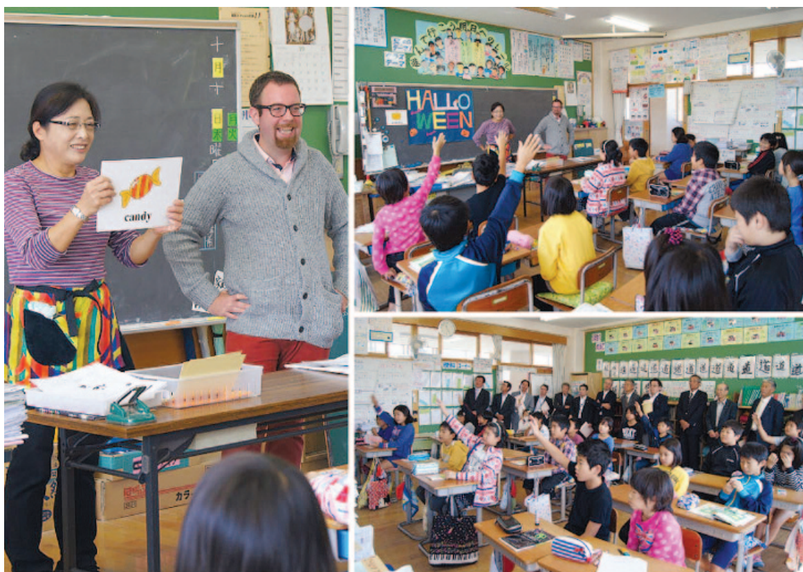
鋸南小学校英語教育視察