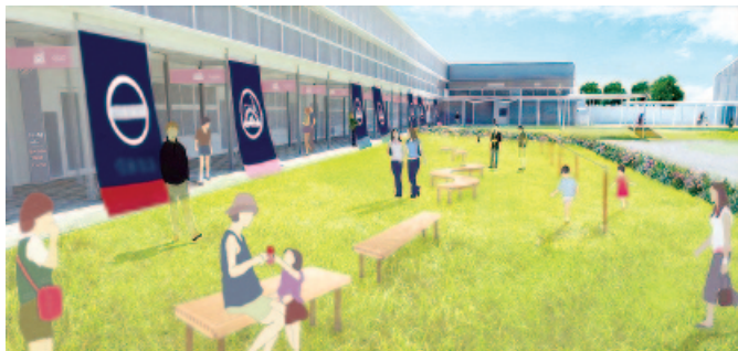
都市交流施設（原っぱ広場）