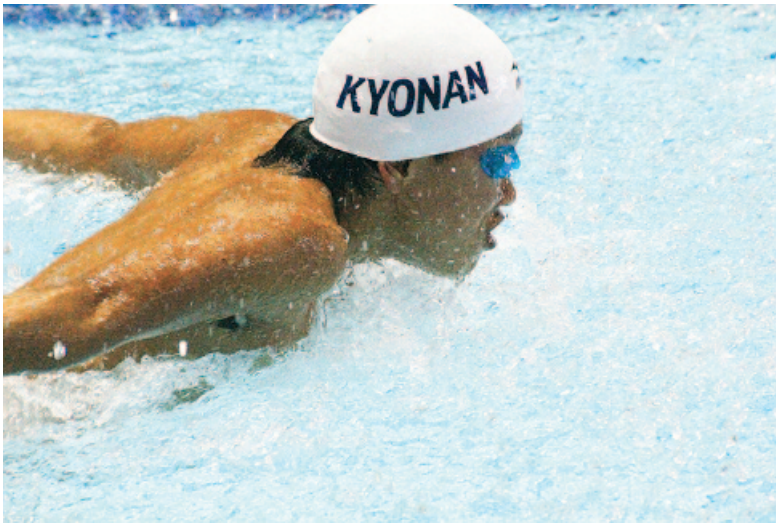
全国ジュニア水泳競技大会での力泳

南房総3市との連携をとり、このチャンスをしつかりとつかんで、鋸南町、南房総地域の発展につなげていきましょう。