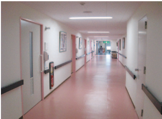
改修を行った鋸南病院

行政委員及び非常勤特別職に対する報酬は、財政状況の悪化から、平成18年度から10%の削減を行ったが、それら減額した報酬を5%元に戻し増額改正を行うほか、新たに有害鳥獣対策実施隊員にかかる報酬を追加した。 この条例は、平成26年4月1日から適用するもので、条例改正に伴う必要額は99万7千円を見込んでいる。 鋸南病院では、現在休床している3階病床を医療療