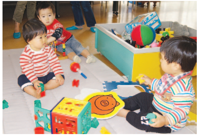
子育てサロン (すこやか)