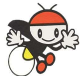
辰野町イメージ キャラクター 「ぴっかりちゃん」