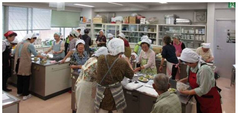
災害に備えてパッククッキング(すこやか)6月11日(月)