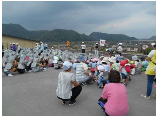
（写真：鋸南小学校屋上）

最近各地で大きな地震が発生していることから、子ども達は真剣に訓練を行っていました。保育所の避難訓練では、日頃の訓練の成果もあり、子ども達は先生方の誘導により、速やかに鋸南小学校の屋上へ避難することができました。