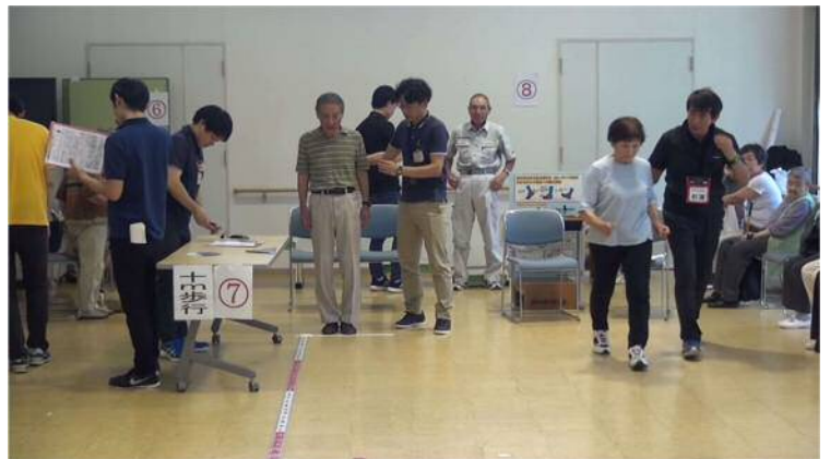
介護予防健診(すこやか)6月8日(金)