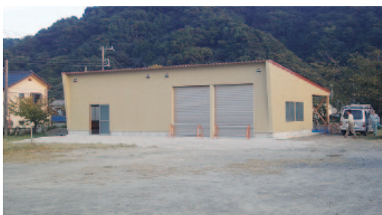
すこやか 東側に建てられている 倉庫

るが、この町には他にも行事の実行委員会がある。他の会でここを使いたいとの申し入れがあったら使えるのではないかと。「多目的倉庫」としたらどうか。 総務企画課長 希望があり、夏の高温を考慮した物なら対応は可能ですので、空きスペース等協議します。 町長 「多目的」という形での、有効活用を考えます。要望 町の活性化のため、有効活用を望む。