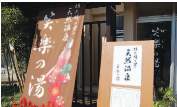
温泉化された老人福祉センター笑楽の湯

て、消火栓ボックス内のホースや筒先など、かなり古くなっているものもある。更新していく予定は。 総務管理室長 消防団の方々に定期的に点検してい