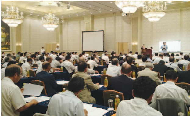
県町村議会議員研修会に参加

8月3日、地方創生等をテーマに千葉市内で開催された千葉県町村議会議員研修会へ参加。