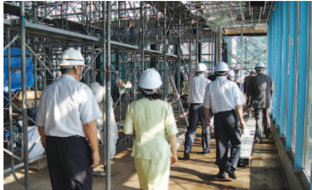
道の駅保田小学校増改築工事現場を視察

9月4日、増改築工事が進む“道の駅保田小学校”を視察。オープンは12月11日を予定。