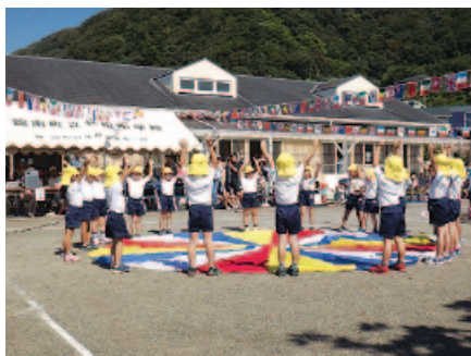
鋸南幼稚園秋の大運動会

が平成28年度となったことに伴い、新幼稚園舎を29年度に建設するスケジュールとなったため。