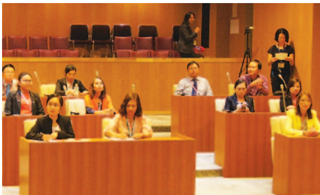
カンボジア・ベトナムの国際訪問団視察に来町

8月31日、外務省が進めている青少年交流事業により、カンボジアやベトナムの若い政治家や官僚22名が視察に来町。