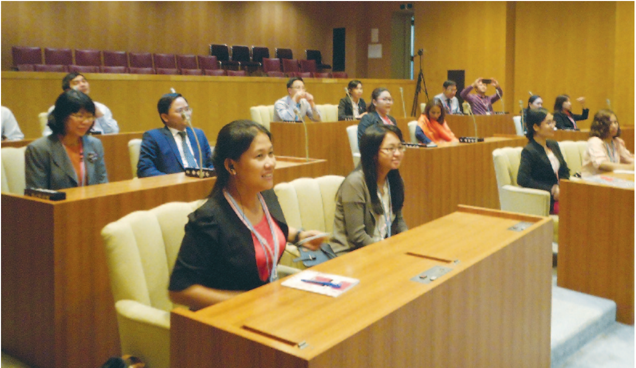
議場の見学に訪れたアジアの若者たち