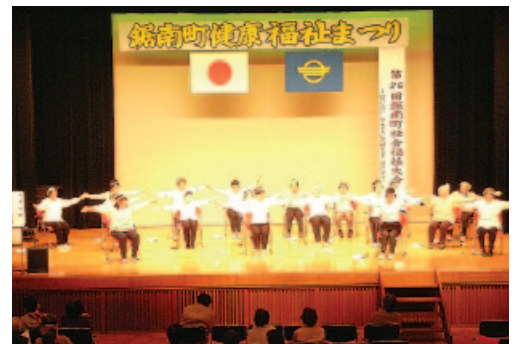
鋸南町健康福祉祭

品』は車庫・倉庫の一部あれば足りる。旧一中の竹の保管状況は確認しているが、かなりのスペースだ。竹灯籠の制作・保管の説明は触れもせず予算を通させたのは、良く解釈しても説明不足であり、議会軽視どころの話ではない。