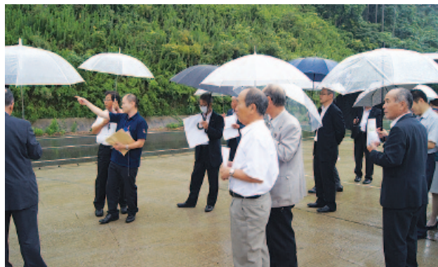
広域ごみ処理施設建設予定地を視察

8月31日、外務省が進めている青少年交流事業により、カンボジアやベトナムの若い政治家や官僚22名が視察に来町。