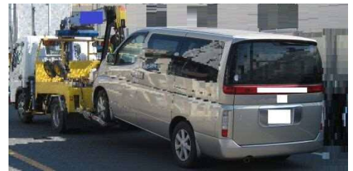
※差押え自動車の引揚げ例