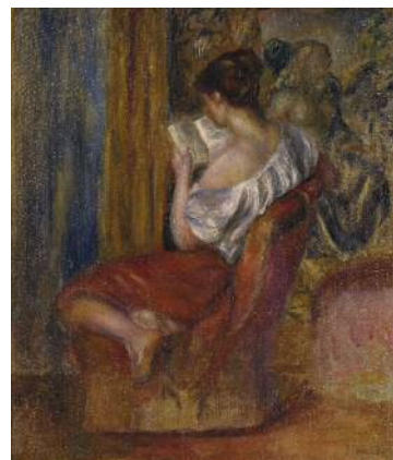
ルノワール「読書する女」