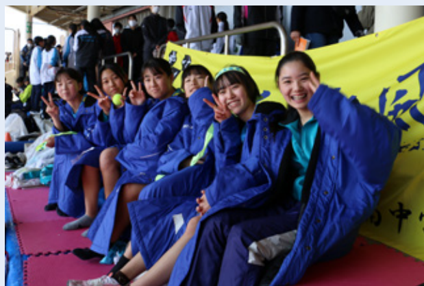
駅伝部のメンバー▶