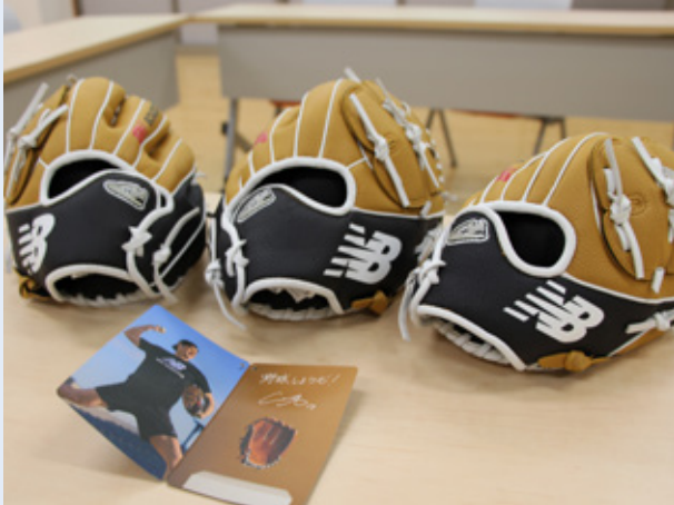
▲寄贈されたグローブとメッセージカード