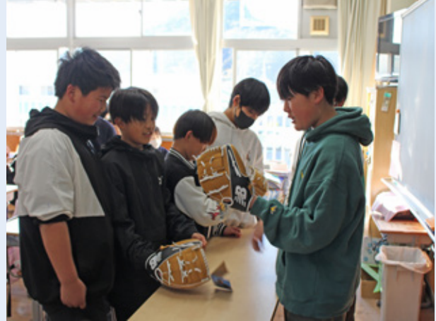
▲グローブに触れる児童