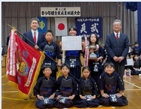
▲安房鋸南剣友会のメンバー