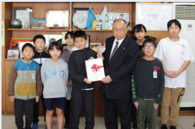
▲鋸南小学校児童による募金