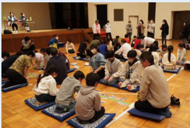
▲カルタ大会の様子

子どもたちは、札が読まれると真剣なまなざしでカルタを取り合い、「楽しかったので、また参加したい」、「鋸南町の色々なことを知ることができた」と笑顔で話していました。