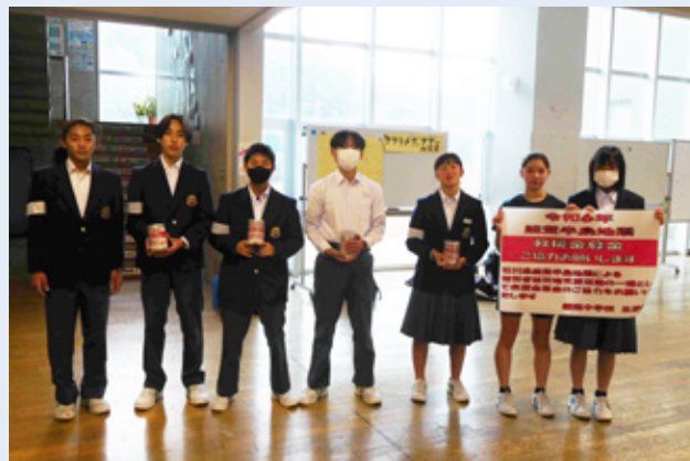
▲鋸南中学校生徒による募金活動