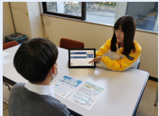
▲ 行政サービス案内の様子

この活動を通じて、広報やホームページ等を介した情報発信だけでは、情報が届きにくかった方々にも、一人ひとりの興味やお困りごとに合わせた行政サービス情報をお届けしていきます。