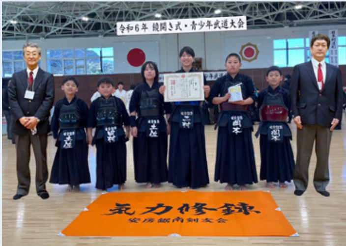
▲出場した安房鋸南剣友会の選手

1月8日に令和6年日本武道館鏡開き式青少年武道大会が開催され安房鋸南剣友会が準優勝の成績を収めました。