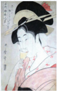
▲名所腰掛八景 梅ヶ香

記念館では彼らの作品を集めた特別展「浮世絵美人」を三月十七日まで開催しています。めったに見られない名品が集まりました。この機会に、ぜひご来館ください。