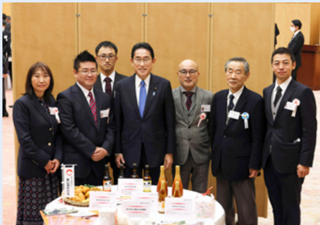
▲岸田総理(中央左)と豊島さん(左)