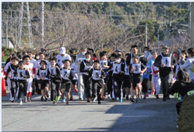
▲スタートする参加者