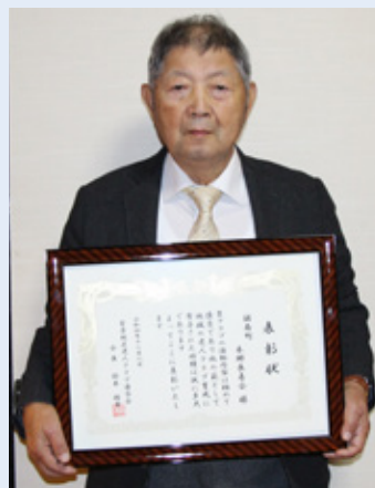
▲本郷長寿会の横瀬会長