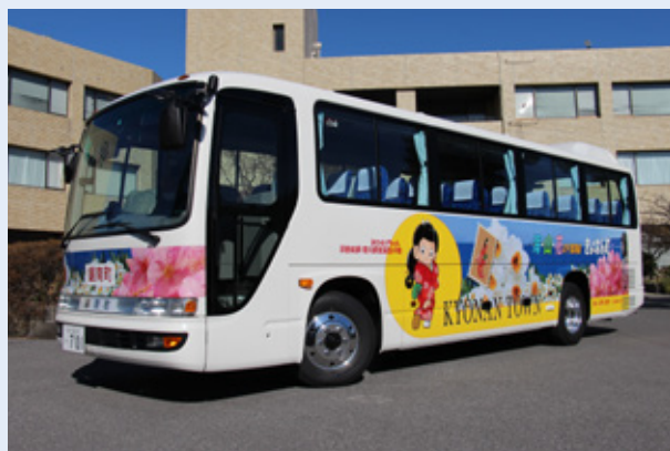
▲新しくなった社教バス