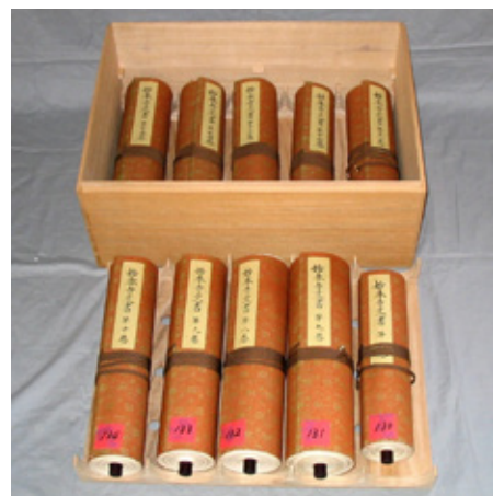
▲妙本寺聖教類及び関係資料 【県指定：有形文化財(歴史資料)】