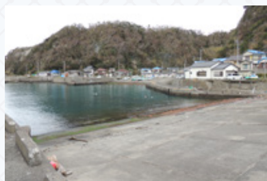
▲特攻本部となった岩井袋

昭和二〇年八月十五日、終戦。勝山や岩井袋で聞いた玉音放送を、彼らはどんな心情で聞いていたのでしょうか。