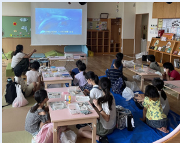
▲放課後子ども教室での活動