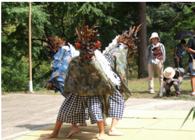
▲市井原獅子舞【町指定：無形民俗文化財】