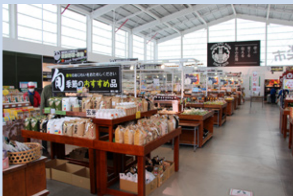
▲直売所「きよなん楽市」

昨年度も町からの指定管理料は0円で施設運営ができました。収益は628万円となり、分配金として町へ377万円が還元され、施設修繕費などに活用されます。