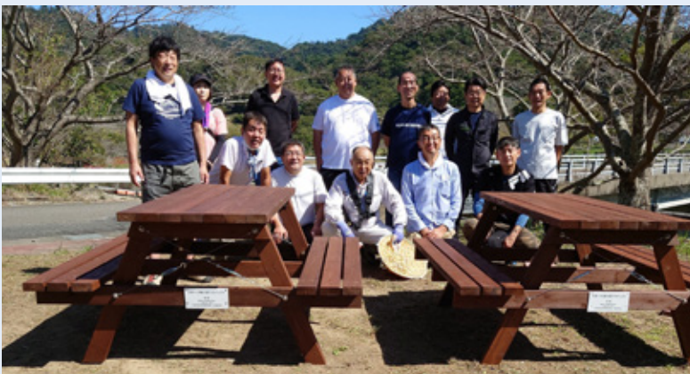
▲寄贈されたテーブルベンチ