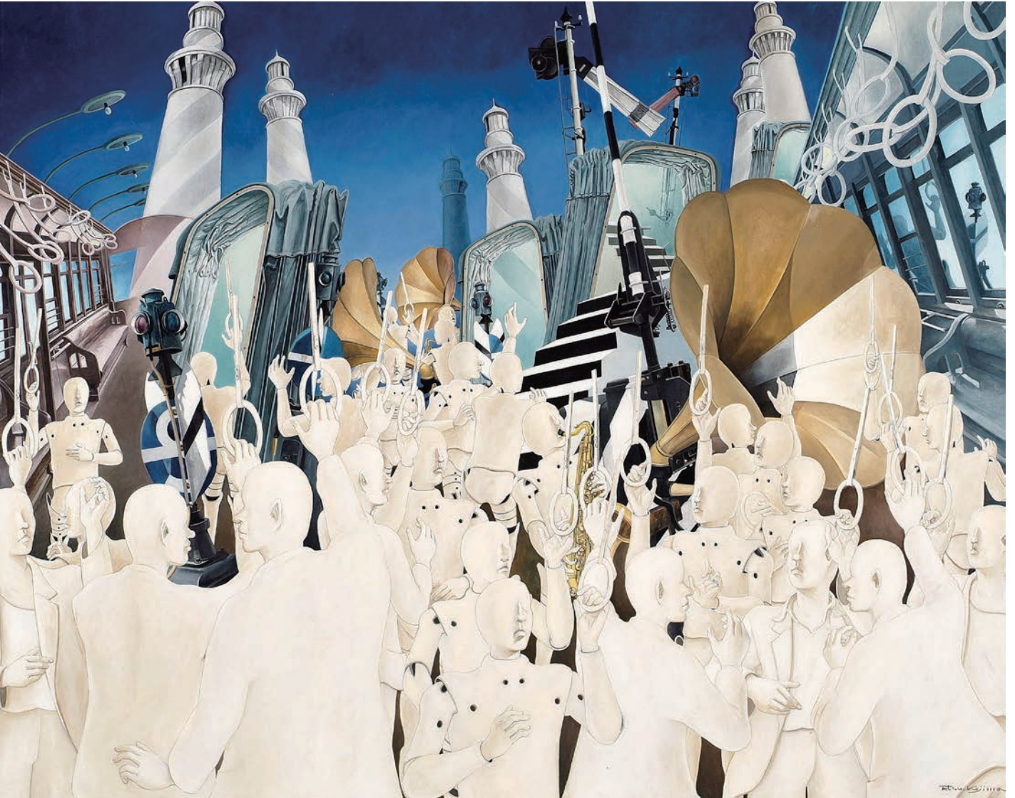
道化の刻 風化する視野

◆入館料 一般・大学生 500円(2,000円) 小中高校生 400円(3,000円) (団体20名以上料金)