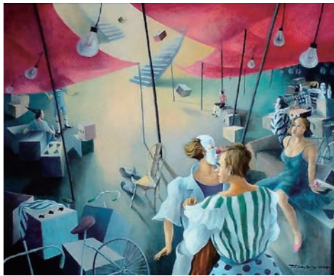
赤いテントと道化師

サーカスのピエロは、ジントラの曲に合わせて演技し人を笑わす。人間が、この地球の中で生の営みを見せる様々な悲喜こもごもの姿もピエロに見えて来ます。そして自分自身もその営みの一人であると。