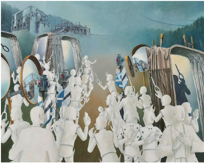
道化の刻 風化する視野