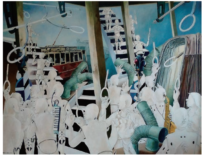
道化の刻 風化する視野