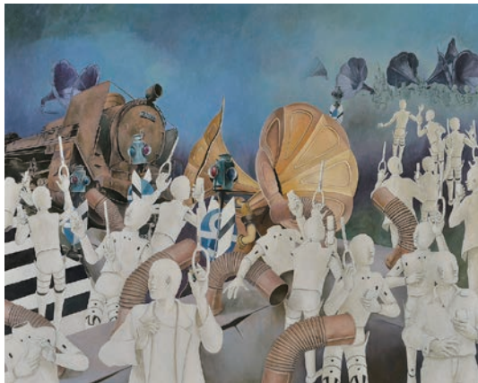
道化の刻 風化する視野