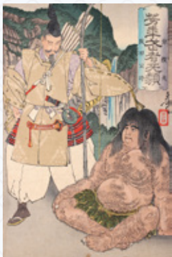
芳年武者無類 源頼光と阪田公時

房総で平忠常の乱を平定し活躍した源頼信。その六代あとの源頼朝です。頼朝には妖怪退治の話はありません。しかし何にも勝る「強運」という力を身につけた男でした。