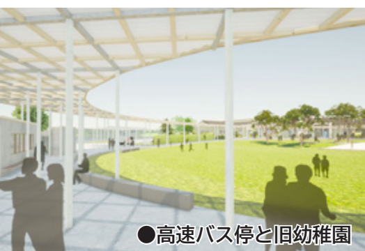
●高速バス停と旧幼稚園