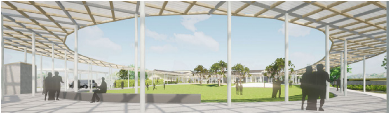
▲敷地を大きく囲む屋根付きの歩道「わっか」