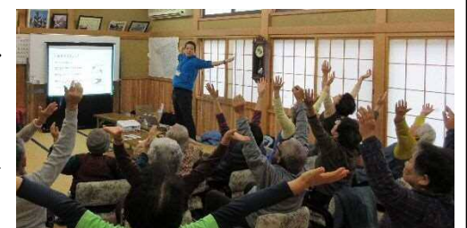
本郷浜区コミュニティセンター