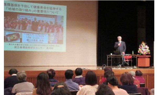
高血圧症予防講演会（60名参加）

脳卒中は早く気づき、発症してから、8時間以内に特殊な治療を受けることで後遺症を軽くすることができます。