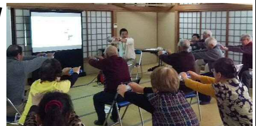
鋸東コミュニティセンター