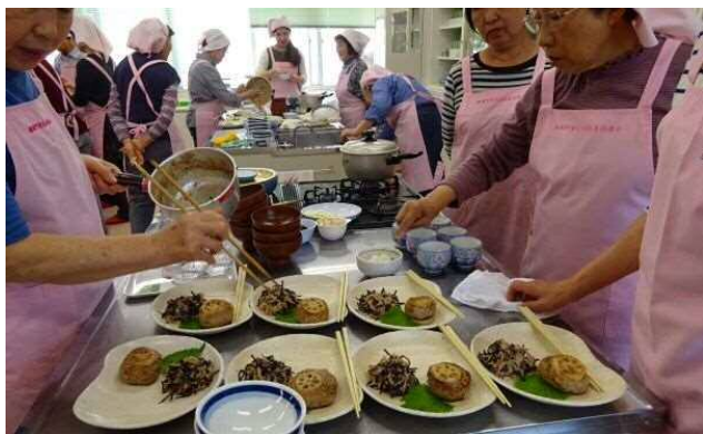
食生活改善協議会による塩分控えめのお料理教室