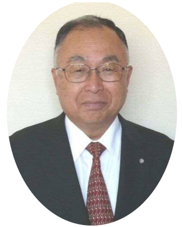
町長 白石 治和

結びに「人が結びつく、賑やかなまち」を目指して、鋸南町の良さを内外にアピールし、町と地域、町民の皆様との連携をより一層深めて参りたく、今後とも、町政への更なるご理解とご協力をお願い申し上げますと共に、皆様のご多幸を心からご祈念申し上げます、新年のあいさつといたします。