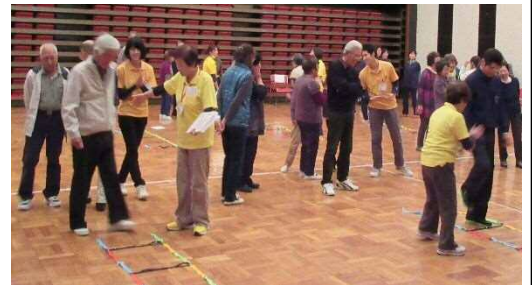
コグニサイズ研修会（50名参加）