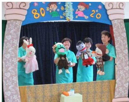
保健推進協議会による虫歯予防の人形劇