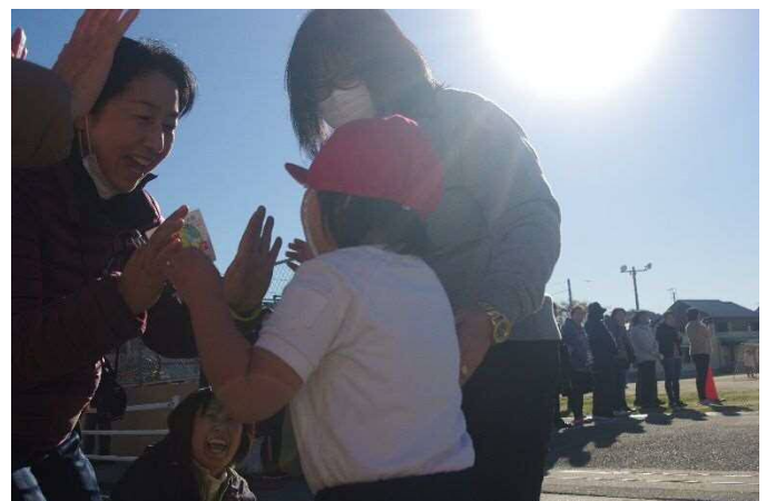
撮影：地域おこし協力隊 室井 翼