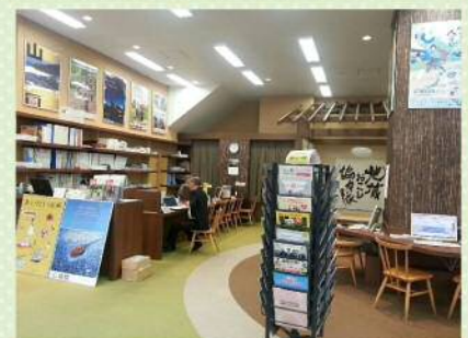
都内にある移住情報ブース。全国の移住関連情報が入手できます。