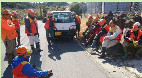
鋸南町鳥獣被害対策実施隊による一斉捕獲活動中の一コマ