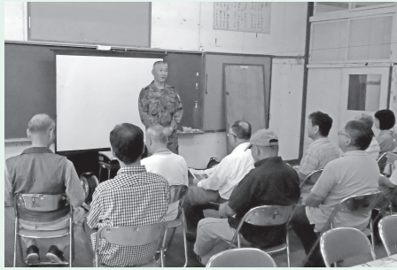
▲隊長の説明を聞く近隣住民の皆さん

6月1日、陸上自衛隊空挺教育隊の空挺レンジャー訓練説明会が旧佐久間小学校で近隣住民等を対象に開催されました。