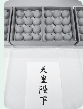
▲天皇陛下献上品の『大房』