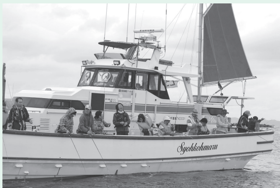
▲釣りを楽しむ参加者たち

6月9日、「第33回きよなん町白キス沖釣り大会」（町観光協会主催）が開催され、県内外から202名が参加し、白キス5匹の重さを競い合いました。