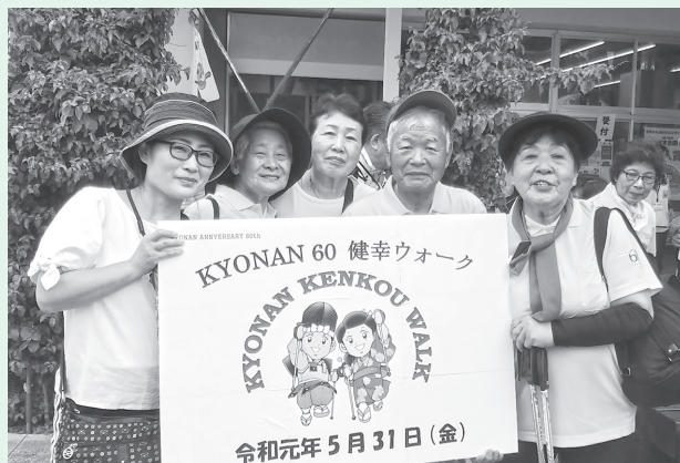
道の駅保田小学校にて▶

イベント終了後には、道の駅保田小学校でおしるこが振る舞われ、心地よい疲れを癒していました。