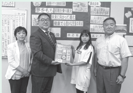
▲ライオンズクラブから図書の寄贈

また、南房総ライオンズクラブからは、鋸南小学校へ図書の寄贈をいただきました。児童の学習支援に有効活用していきます。