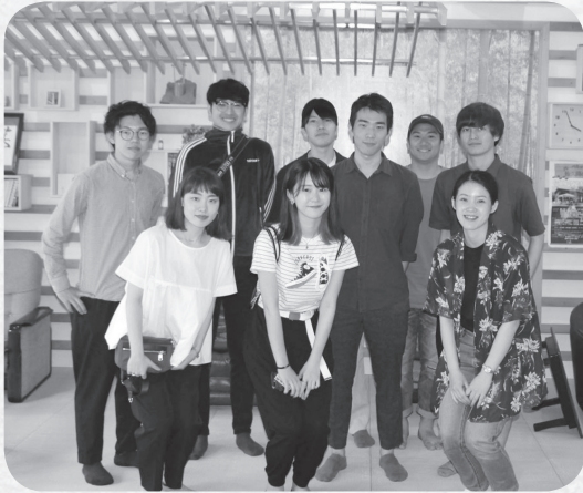
▲鋸南プロジェクトの皆さん

現在は、町に点在する5つの施設を対象として、利活用に関する研究を進めており、今回はこれらの研究内容を紹介します。