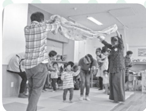
手遊びやリズム体操