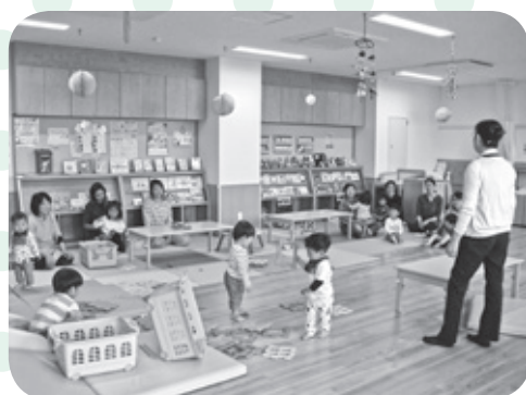
保健師による子育てアドバイス