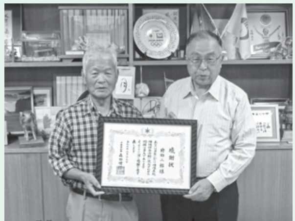
写真左から岩田氏、白石町長▶