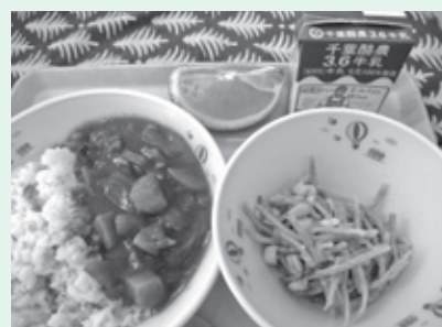
▲じゃがいもを使ったチキンカレー

同サークルからは、地域貢献の一環として収穫した野菜を子ども達に味わってもらいたいと、昨年に引き続き提供いただきました。