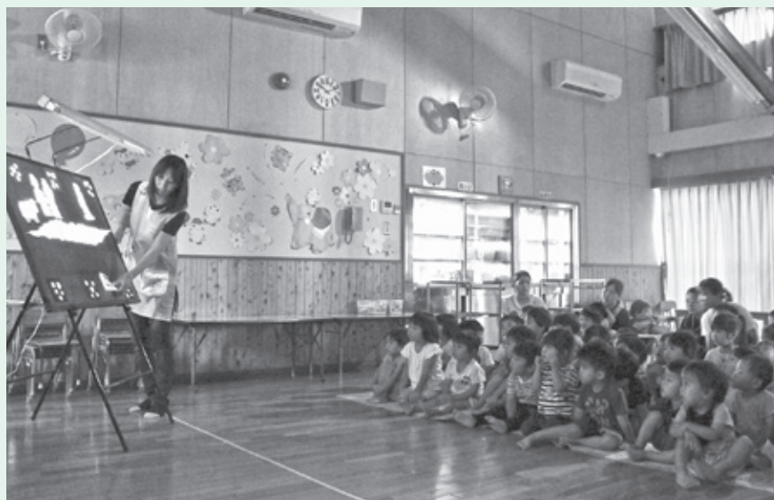
▲人形劇に見入る子どもたち