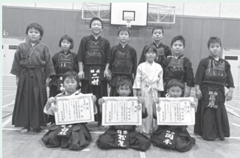
▲鋸南剣道スポーツ少年団の皆さん

毎週火・金曜日 B & G海洋センター 19:00 ~ 土曜日 鋸南小学校体育館 18:30 ~