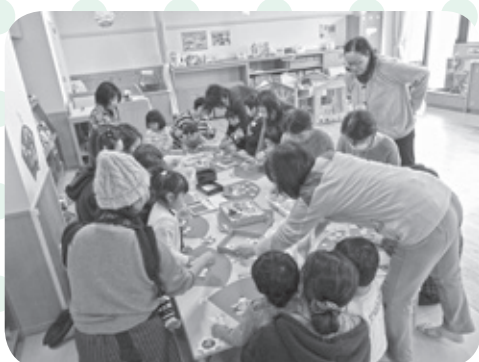
なかよし広場（ひなまつりの飾り作り）

毎月町報きょなんおしらせ版の“くらしのカレンダー”にも掲載しています。 詳細は町ホームページ（「子育て広場」で検索！）をご覧ください。