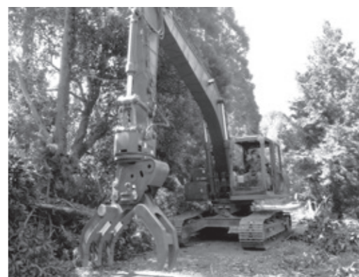
自衛隊による倒木の撤去作業(嶺岡林道)