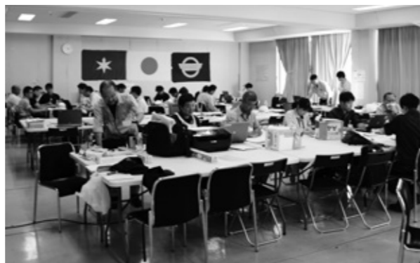
住家被害認定業務にあたる千葉県・神奈川県相模原市・東京都足立区・長野県辰野町の応援職員 多い日には100人以上の職員が従事