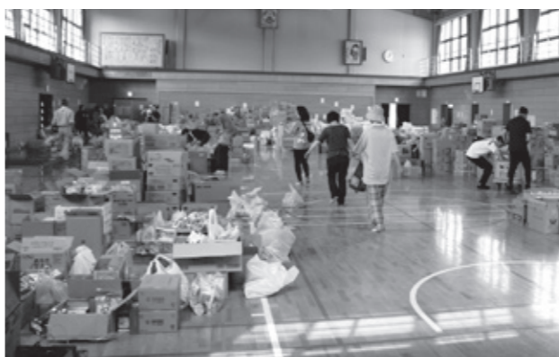
全国各地から届いたたくさんの支援物資