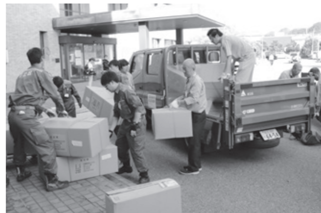
災害時相互応援協定を締結する東京都足立区(上)、長野県辰野町(左)からの物資搬入