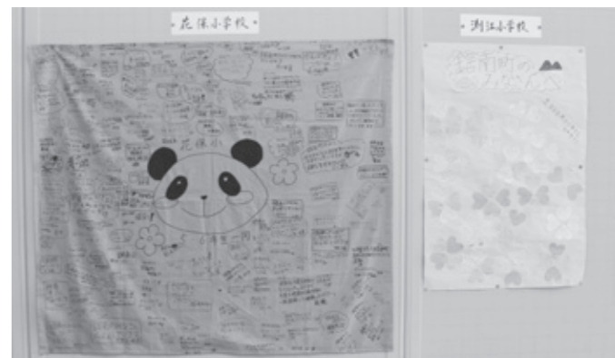
足立区の小学校からいただいた寄せ書き