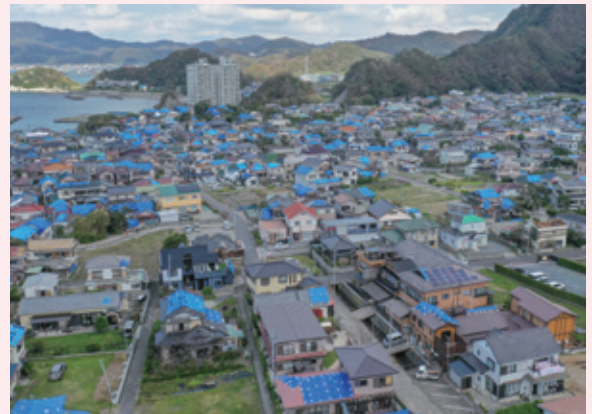
▲令和元年房総半島台風の被災後

薄いブルーシートは防水性能が低く、すぐに破れてしまうおそれがあります。ブルーシートの厚さは#3,000以上を選択するようにしましょう。