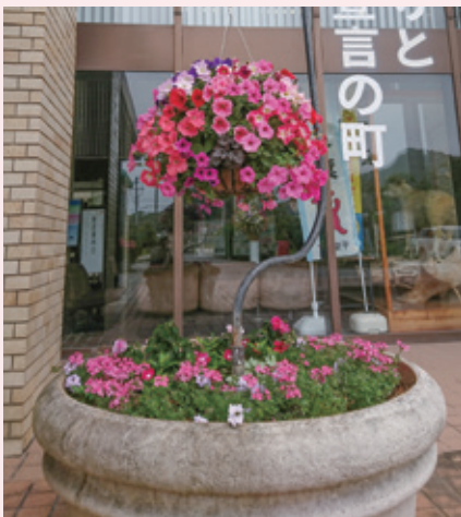
▲役場正面玄関前の寄せ植え

鋸南町CHガーデニング倶楽部は、「一人一鉢」を合言葉に町中を花いっぱい豊かな景観にするため、寄せ植えの活動をしているボランティアグループです。