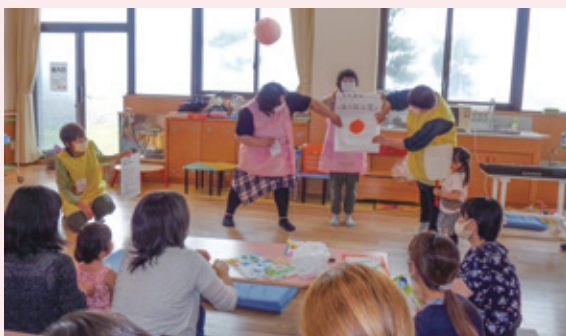
▲なかよし広場での活動

「なかよし広場」が開催されており、そのサポートとして、工作の下ごしらえや読み聞かせの準備などを行っています。