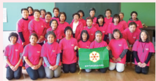
▲食生活改善協議会のメンバー