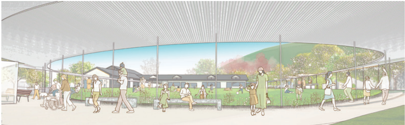
都市交流施設周辺整備「わっか」イメージ 遠藤克彦建築研究所・アトリエコ設計共同体 提供

旧鋸南幼稚園や旧保田小学校のプール等を活用して、都市交流施設と連携を図り、何度でも訪れたい魅力ある施設整備を行うため「都市交流施設周辺整備事業」を進めています。