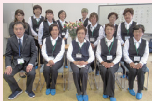
▲保健推進員協議会のメンバー