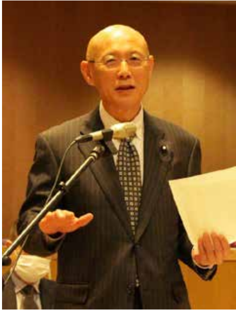
竹田 和明 議員