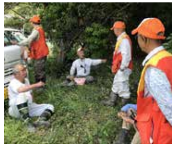
鳥獣被害対策実施隊員

昨年4月の会計年度任用職員制度を導入する際に、区分や金額について検討を行っていただきますので、今回は実施隊員のみについて検討しました。