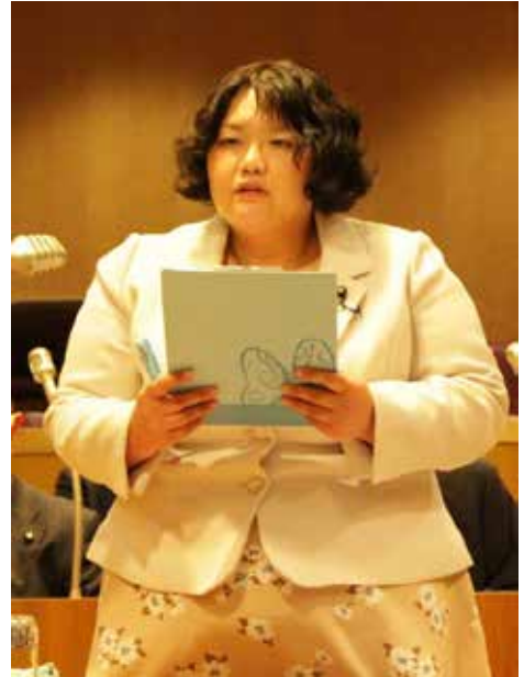
笹生 あすか 議員