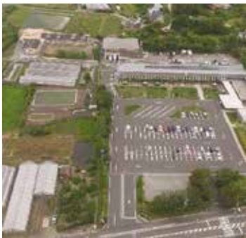
都市交流施設周辺整備の用地