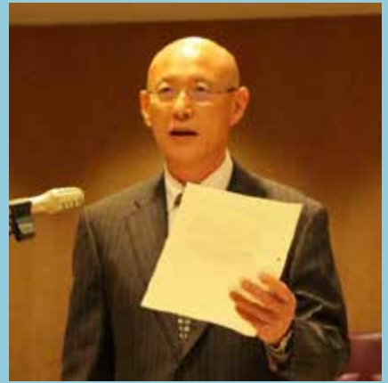
竹田 和明 議員