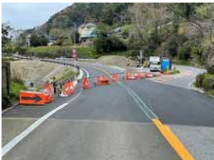
町に移管される旧県道（写真右側）

県道鴨川保田線の改良に伴い、町に移管される市井原地先の旧県道93・7メートルを新たに町道3039号線として認定するもの。全員賛成で可決。