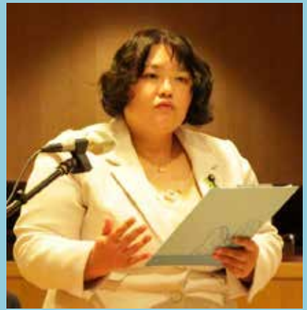
笹生 あすか 議員