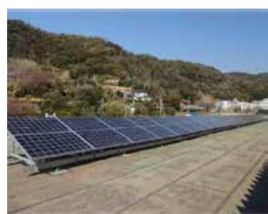
道の駅保田小の太陽光パネル

問 「地球温暖化対策の推進に関する法律」では、「公共団体実行計画」を策定し、温室効果ガス総排出量を公表することとされているが、その策定状況は。