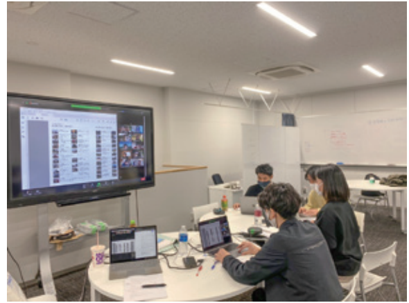
▲意見交換会の様子（学生）