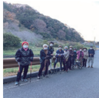
▲富士見クラブ（大帷子下）の活動の様子