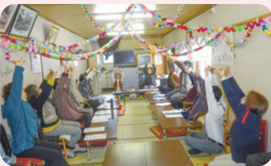
▲「憩いの場」の様子 ※平成30年12月撮影

サロン事業「憩いの場」支援隊15名は、町区と両向区で「憩いの場」の運営支援やパンフレット作成、お茶出しなどを行っています。「憩いの場」では自分達が暮らす地域で、楽しく元気に心地よく暮らしていけるよう地域の絆を育み、やりがいや生きがいを見つけながら過ごしていく場を提供しています。