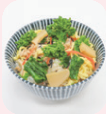
▲菜の花の炊き込みご飯

12月21日に小中学生を対象に募集した「鋸南の菜花 メニューコンテスト」の表彰式が開催されました。