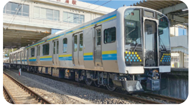
▲導入される新型車両(E131系)

この新型車両は、車内の一部ドア上部に案内表示画面が設置され、運行情報などが提供されます。また、「半自動ドア機能」が使用されます。