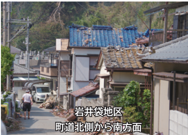
岩井袋地区 町道北側から南方面