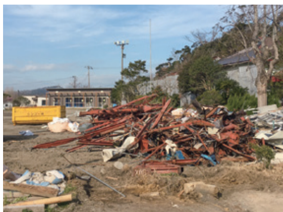
公共施設の復旧や解体