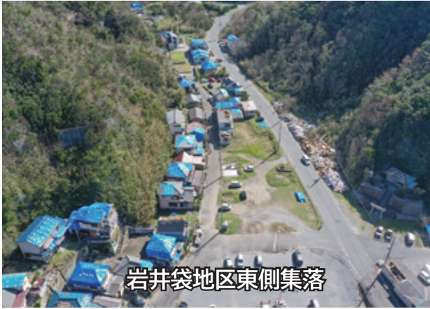
岩井袋地区東側集落