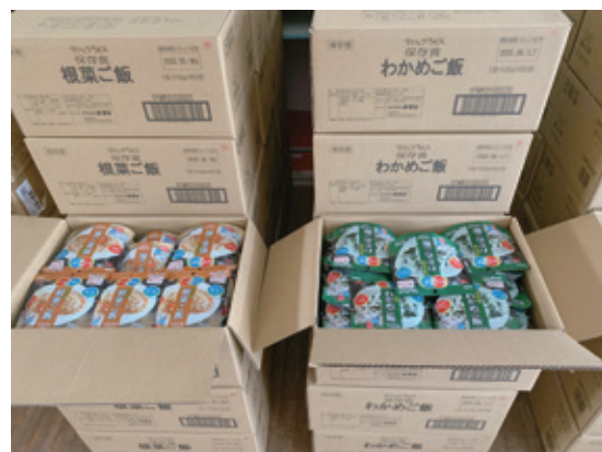
防災備蓄品の購入