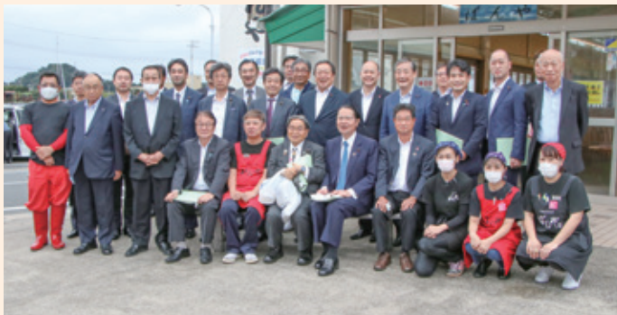
▲ばんやを訪れた視察団の様子

衛藤会長は「現場の声をしっかりと受け止め、関連予算の獲得や税制など、今後の政策に反映させたい」と話しました。