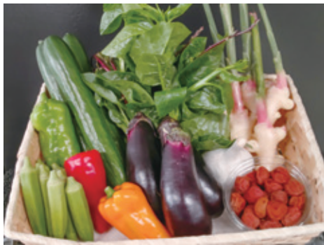
▲農産物詰合せセット（道の駅保田小学校）

10月からふるさと納税のお礼の品をリニューアルしました。登録されているお礼の品を紹介します。