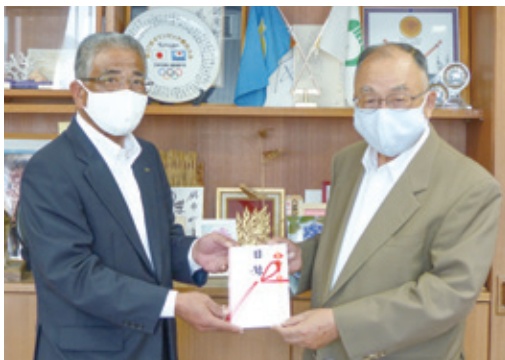
▲左から笹子常務理事、白石町長