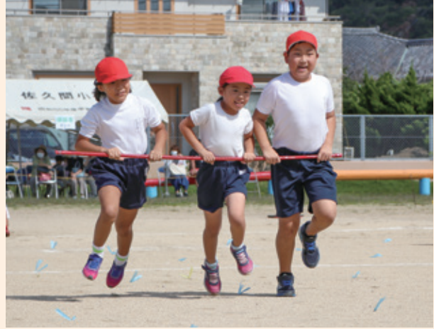
▲小学校低学年（2年生の「まわれお団子3兄弟」）