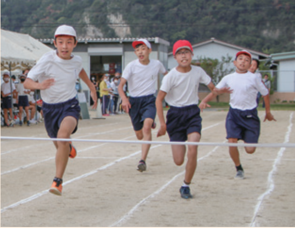
▲小学校高学年（6年生の徒競走）

※保育所の運動会は10月17日に予定されていましたが、雨天のため中止となりました。