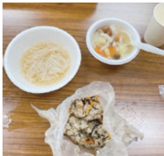
▲調理したひじきごはんなど