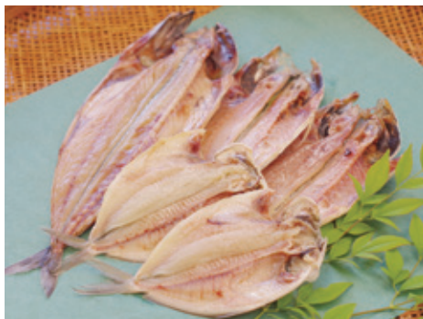
▲【手塩づけ】厳選干物セット（提灯屋干物店）