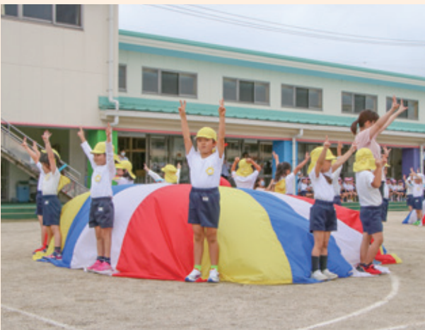
▲幼稚園年長（バルーン「アゲアゲ・気分」）