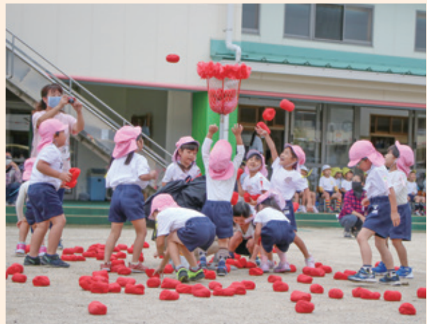
▲幼稚園年少（玉入れ「赤い玉・白い玉」）