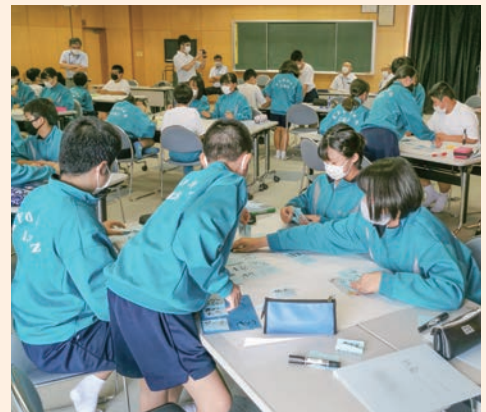
▲意見交換を行う生徒たち