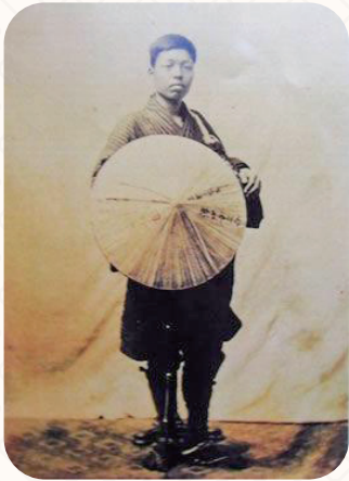
房総旅姿の正岡子規