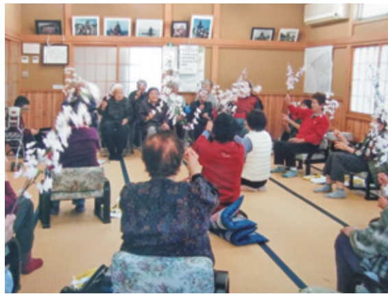
▲歌を口ずさみ楽しく健康体操 (新型コロナウイルスの流行前)

浜げんき会は、これからも高齢者のみなさんが元気に過ごせるよう、地域での支え合い活動を続けていきます。