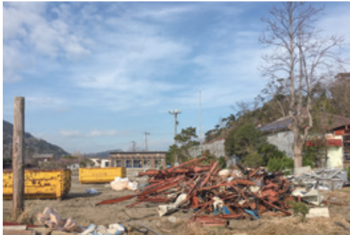
公共施設の撤去や復旧