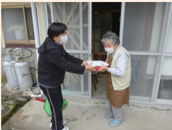
▲お弁当を届けるボランティア活動

平日を活動日とし、お昼前にお届けできるよう11時頃に昼食のお弁当を受け取り、活動に出向いています。