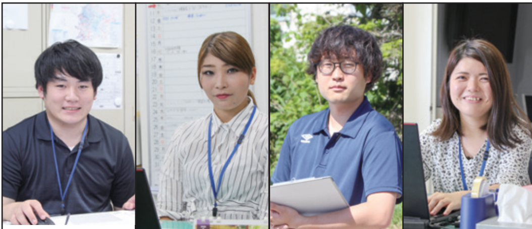
▲令和2年度新規採用職員