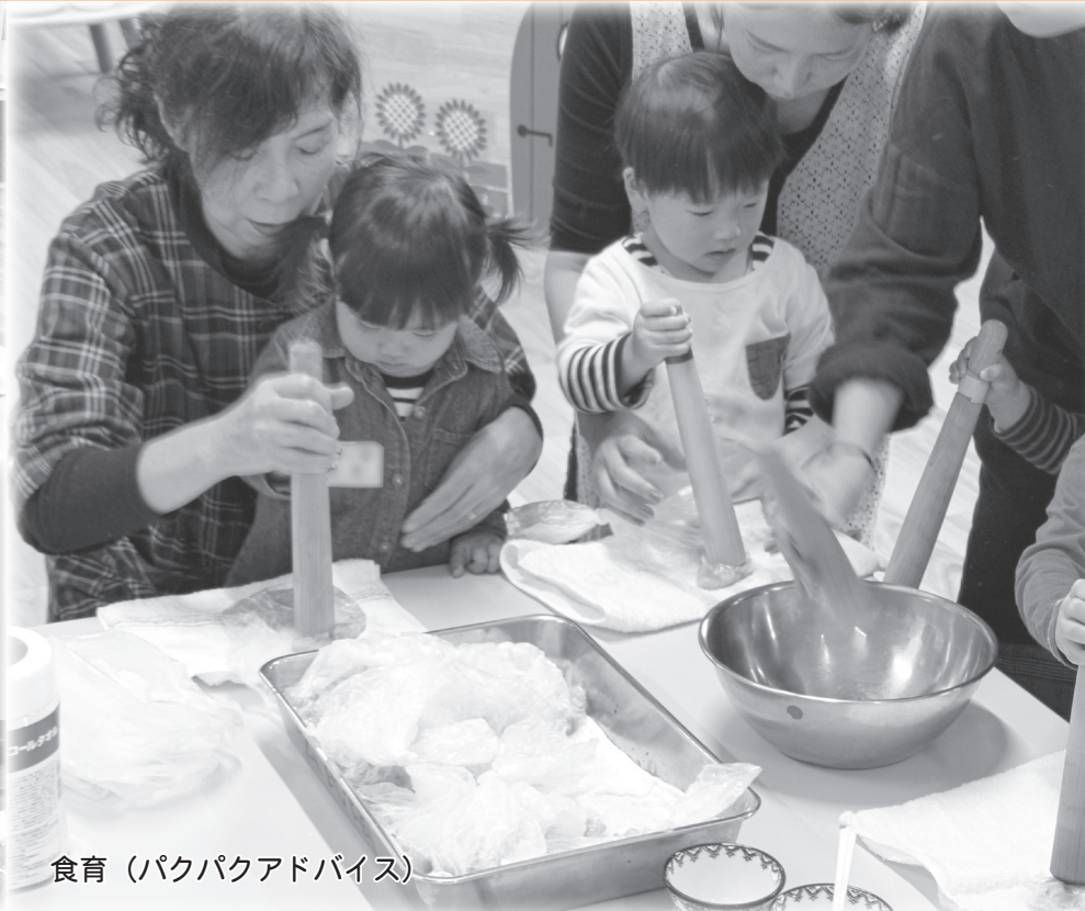
食育 (パクパクアドバイス)