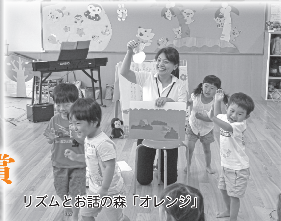
リズムとお話の森「オレンジ」