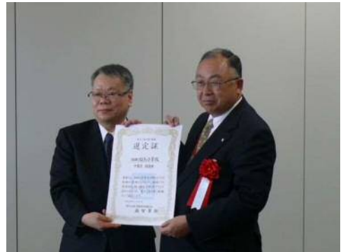
白石町長(右)と越智関東地方整備局長(左)

引き続き、施設の開業に向け、町民の皆さんや施設の運営等に関わっていただく方々とともに、地域活性化の拠点として、また町内外の多くの方々に利活用いただける施設として整備を進めます。