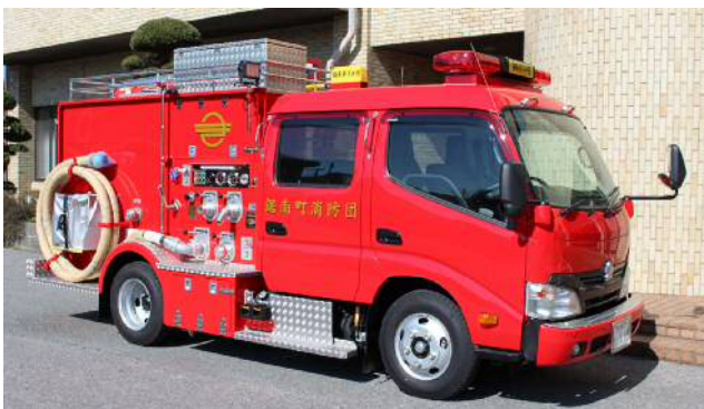
第3分団へ配備された水槽付CD-I型消防ポンプ自動車