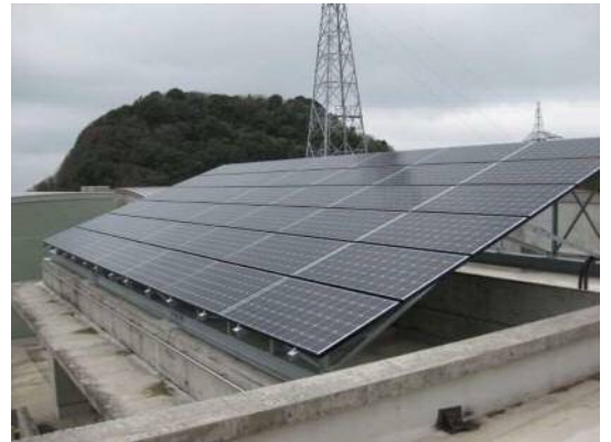
庁舎棟屋上へ設置された太陽光パネル