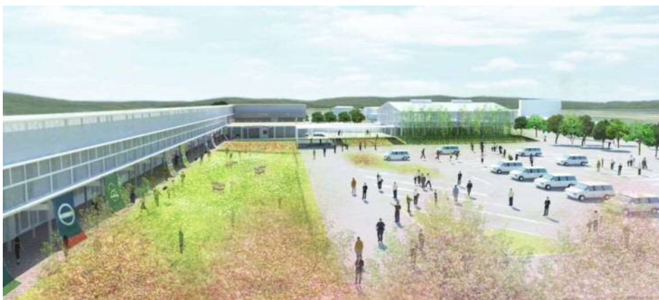
道の駅「保田小学校」完成イメージ図