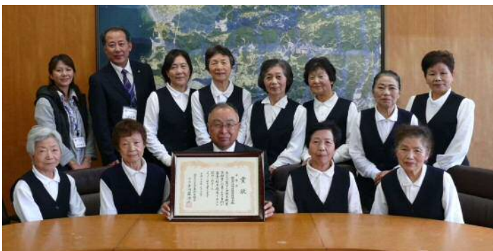
受賞された保健推進員協議会のみなさん

地域における健康づくり活動を一定の事業に着目して2～3年以上実施している団体への表彰です。