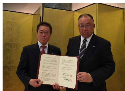
理容組合館山支部との協定