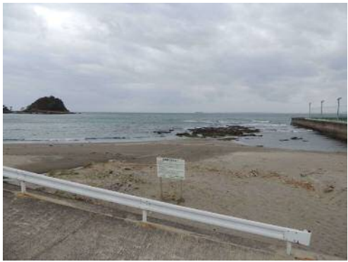
ギスが浦と仏崎跡

どんな地名にも、私たちが遠く忘れ去ってしまったかも知れない、その土地の古い記憶を刻んでいる場合があるのです。