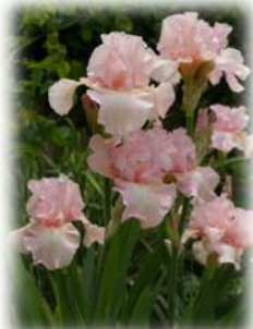
開花したジャーマンアイリス

別名ドイツアヤメとも呼ばれるアヤメ科の植物で、4月から5月にかけて開花します。色は、白や黄色、青などさまざまな色の種類があります。