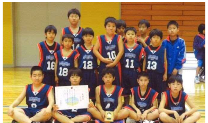
3位に入賞した鋸南バジャーズのみなさん