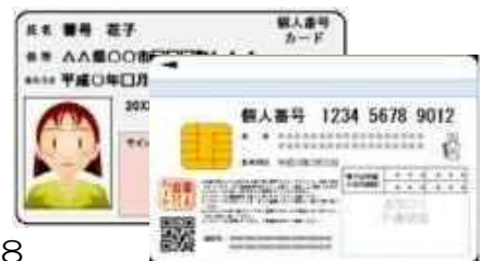
個人番号カードのイメージ