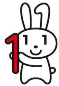
マイナンバー キャラクター マイナちゃん

◇問合せ先 マイナンバーコールセンター TEL0570-20-0178 税務住民課 住民保険室 TEL55-2112