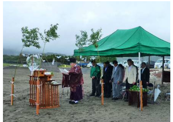
写真右上から夏期観光安全対策会議、海の祈願祭