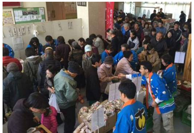
大盛況のたつの特産品フェア

農産物共進会では、前日に町内の農家から153点の農産物が出品され、千葉県安房農業事務所・千葉県農林総合研究センター暖地園芸研究所の職員による