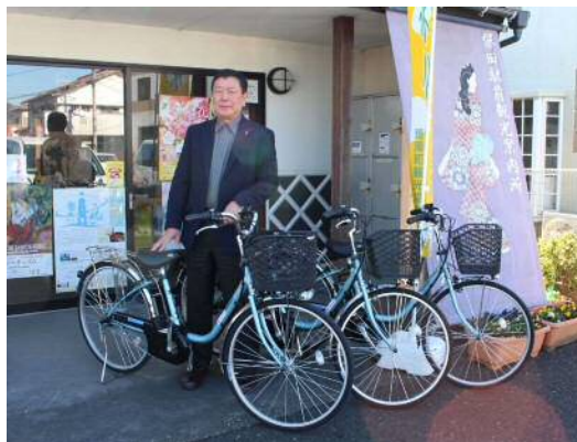
寄贈された電動アシスト付き自転車

寄贈された自転車は、勝山観光案内所に2台、保田観光案内所に3台設置され、町民の方々や観光客が各市町での共同利用を含め、幅広く活用されることが期待されます。