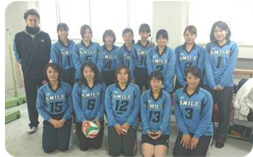
「スマイル」チームのみなさん

県内のB&G海洋センター所在自治体対抗の婦人バレーボール大会が、大多喜町海洋センターで開催されました。町からは、「スマイル」チームが参加し、横芝光町といすみ市と対戦。惜しくも決勝リーグへの進出は逃しましたが、他センターとの交流を深めることができ有意義な大会となりました。