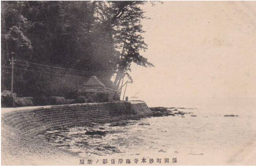
屋茶ノ影日岸海寺本妙町田保

鋸南町の昔の風景を知る資料として、昭和の初め頃の観光写真絵はがきが多く残されています。現在では景観がすっかり変わってしまつた場所もあります。ちよつと昔の鋸