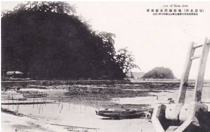
View of Hota Awa 屋茶影日岸海田保(所名房安) 山村 阿可許銀七九華乙地勝令町海陸運京