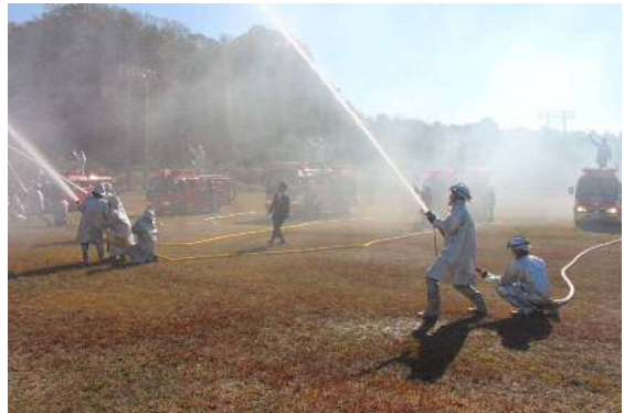
消防団員による一斉放水

また、人員・服装及び機械器具点検として、消防団員の服装、消防車両の管理状況が町長及び来賓により実施されたほか、功労消防団員の表彰が行われ、最後に恒例となった水槽付き消防ポンプ自動車と館山消防署の梯子車を使った一斉放水が披露され、出初式の幕を閉じました。