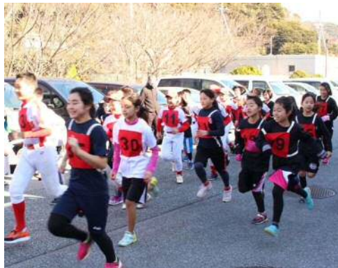
2,000mの部 スタートの様子