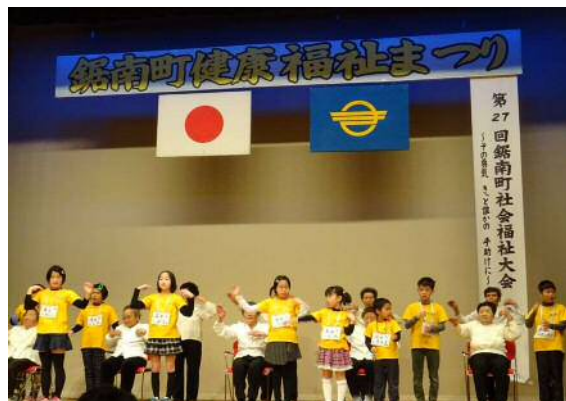
中佐久間元気クラブによる実践発表