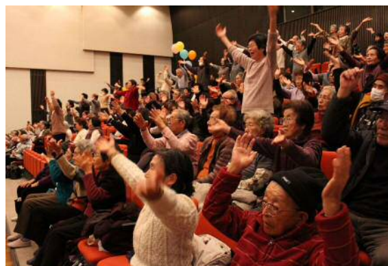
来場者も一緒に健康体操