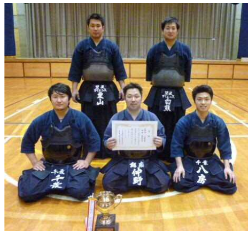
優勝した鋸南剣友会のみなさん