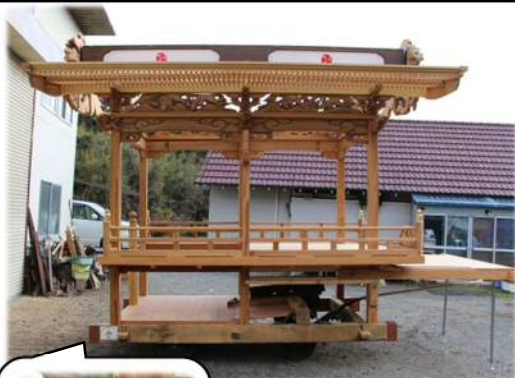
改修された田町区の屋台