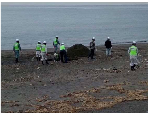
千葉県建設業協会による美化活動の様子

昨年の11月30日、千葉県建設業協会館山支部による美化活動が、元名海岸で行われました。今回は台風21号による海藻・流木などの漂着ごみが撤去され、新年を前に海岸の美観が蘇りました。