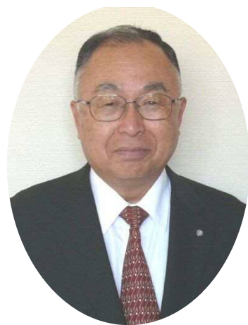
町長 白石 治和

結びに、皆様のご多幸を心からご祈念申し上げますとともに、今後の町政運営にご理解ご協力を賜りますようお願い申し上げます。