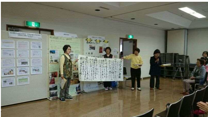
本郷浜げんきかい（ポスター発表）

開会セレモニーでは田町福寿会が竹太鼓と健康体操を披露しました。ポスター発表では本郷浜げんきかいが普段の活動の様子や、会のテーマソング「げんきかい音頭」を披露し、座長賞を受賞しました！会場の皆様からは「鋸南町の高齢者は元気で、町民自らが主体的にお金をかけずに、頭を使って、健康維持に取り組んでいることが素晴らしい」「南房総で最先端をいっている」とお褒めの言葉を頂きました。田町福寿会、本郷浜げんきかいの皆様、ありがとうございました！