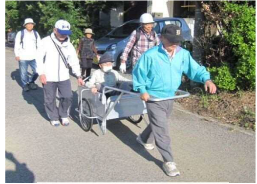
避難支援訓練の様子

避難訓練終了後には6箇所の避難所で、消火栓取扱い訓練、土のう製作訓練、救急法講習、防災学習、給水訓練、非常食の試食などを行いました。町では今後も訓練を実施し、防災対策に努めていきます。