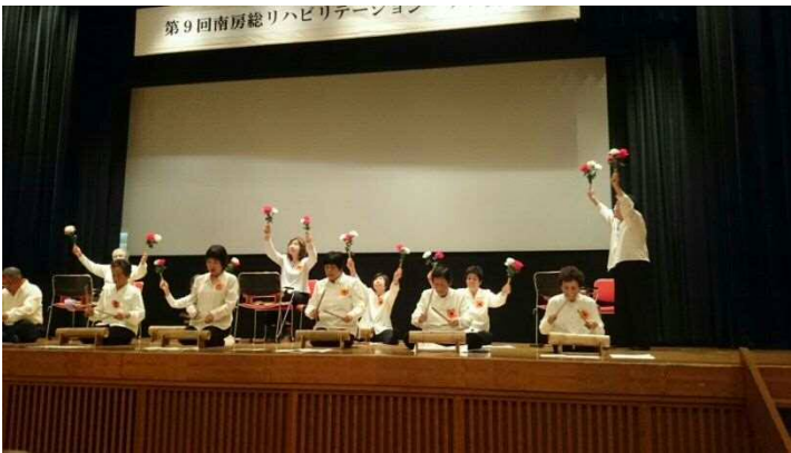
田町福寿会（開会セレモニー）

平成29年10月14日（土）に鋸南町中央公民館において、高齢者や障害者がいつまでも健康で、いきいきとした生活ができるように、幅広いリハビリテーションが利用できる連携体制を図ることを目的に、南房総リハビリ・ケア文化祭が開催されました。小雨が降ってはおりましたが、130名の方が参加されました。