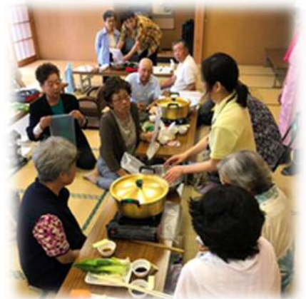
大帷子下地区にて

鋸南町保健福祉課と食生活改善協議会が、「災害時にも役立つ! パッククッキングで美味しく減塩」をテーマに、管理栄養士による講話と、食生活改善推進員による調理実習を実施しました。6月から8月にかけて、コミュニティセンター等町内11か所で開催し、合計170名が参加しました。