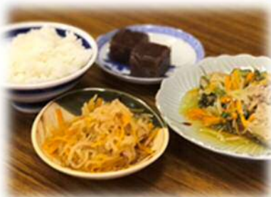
すべてポリ袋で作りました!

パッククッキングとは、食材をポリ袋に入れて空気を抜き、湯の中で加熱する調理方法で、災害時にも役立つとされている調理方法です。ポリ袋で料理するのは初めての方がほとんどでしたが、参加者からは「ポリ袋で作ったとは思えない」「おいしい」などの感想が聞かれ、近所の方と楽しくお話ししながら、パッククッキング体験をしました。