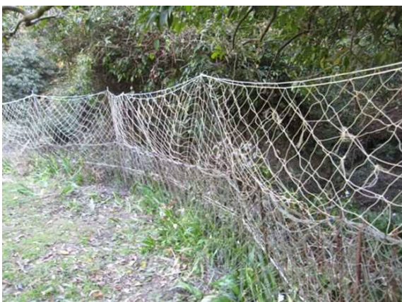
ワイヤーメッシュ柵とのりあみの複合侵入防止柵 (鋸南町小保田地先)