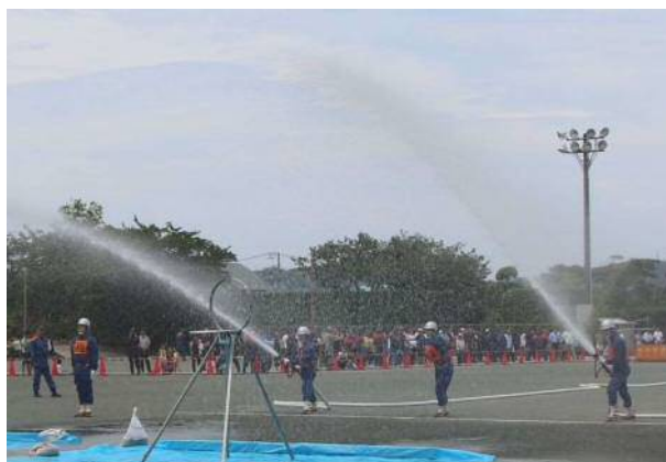
第1分団のポンプ車操法の様子