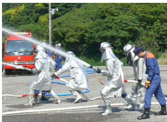
鋸南分署職員の方による団員への指導

訓練指導は、館山消防署鋸南分署の職員が担当し、多種多様なケースを想定した、活動時における安全管理の講義や機械器具の操作・講習が行われ、教官の指導に団員は熱心に聞き入っていました。