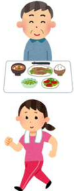
(保健福祉課 健康推進室)

現在開催中・募集中の教室 「からだサビない教室」 「健康づくり教室」 ↓暮らしのカレンダー参照