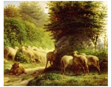
ジャン・フランソワ・ミレー 「堰根に沿って草を食む羊」

今回、千葉県立美術館の特別協力で、日本近代洋画の先駆者と呼ばれる浅井忠をはじめ、ミレー・ルソー・フォンタネージなどの日本画壇に大きな影響を及ぼしたバルビゾン派の作品が記念館にやってきましたので、ぜひご覧ください。