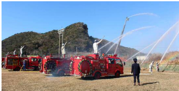
消防団員による一斉放水