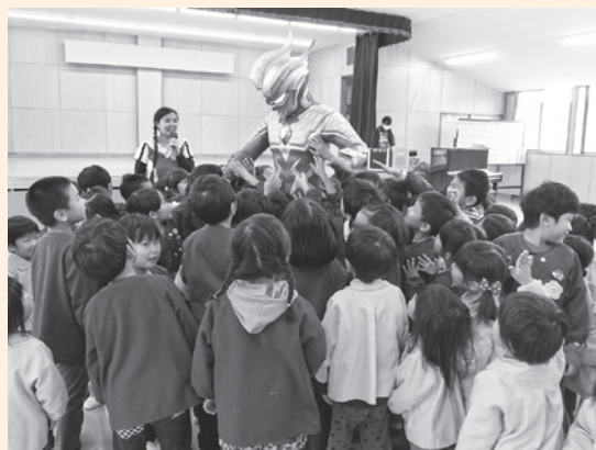
▲「ウルトラマンゼロ」に集まる子どもたち

幼稚園と保育所の子どもたちは、一緒に体を動かしたり、プレゼントをもらったりして楽しく過ごしました。