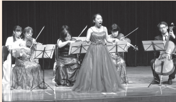
▲中央公民館で開催されたコンサート

2月15日、中央公民館と道の駅保田小学校で「音楽で被災地を支援する会」の主催により「鋸南町応援 復興コンサート」が開催されました。