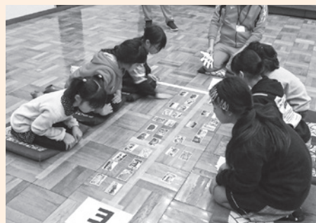
▲取り札の獲得を狙う子どもたち

今後、さらにかるたの充実を図るために、青少年相談員を中心にかるたのリニューアルをする予定です。