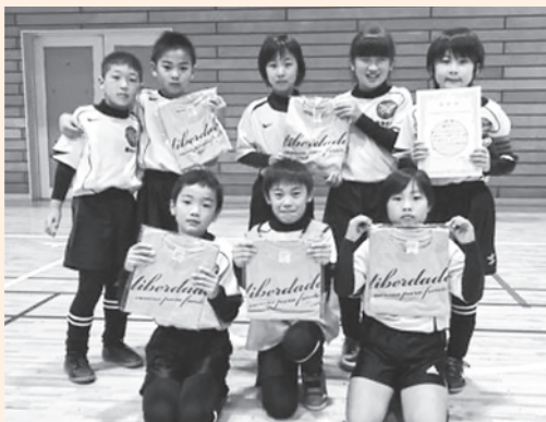
▲鋸南FCのチームの皆さん

鋸南FCは3月8日に柏市で開催される決勝大会への出場が決定しました。この大会は東北・関西・沖縄での予選を勝ち抜いたチームが出場する全国規模の大会で、活躍が期待されます。