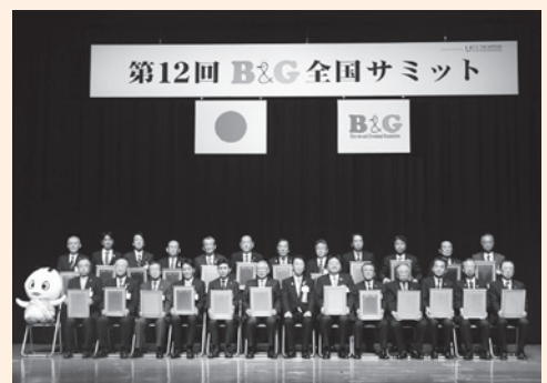
鋸南町：下段、右から4列目▶

これにより、平成26年度にプール大規模改修として3,000万円の助成金を受けており、来年度には体育館施設の改修に向け、修繕助成金を申請しています。